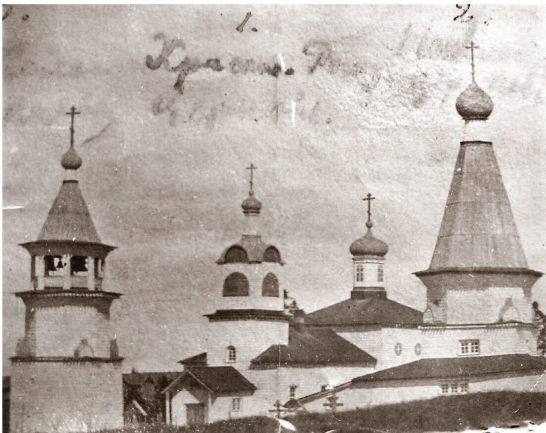
Рисунок 1. Храмовый комплекс в селе Пурнема. Фото начала XX века. Справа – шатровая Никольская церковь (1618?), в центре – Рождественская церковь с приделом св. Власия (1857–1861) и слева – колокольня (1772) – из: Бокарев и др. 2014 14 .