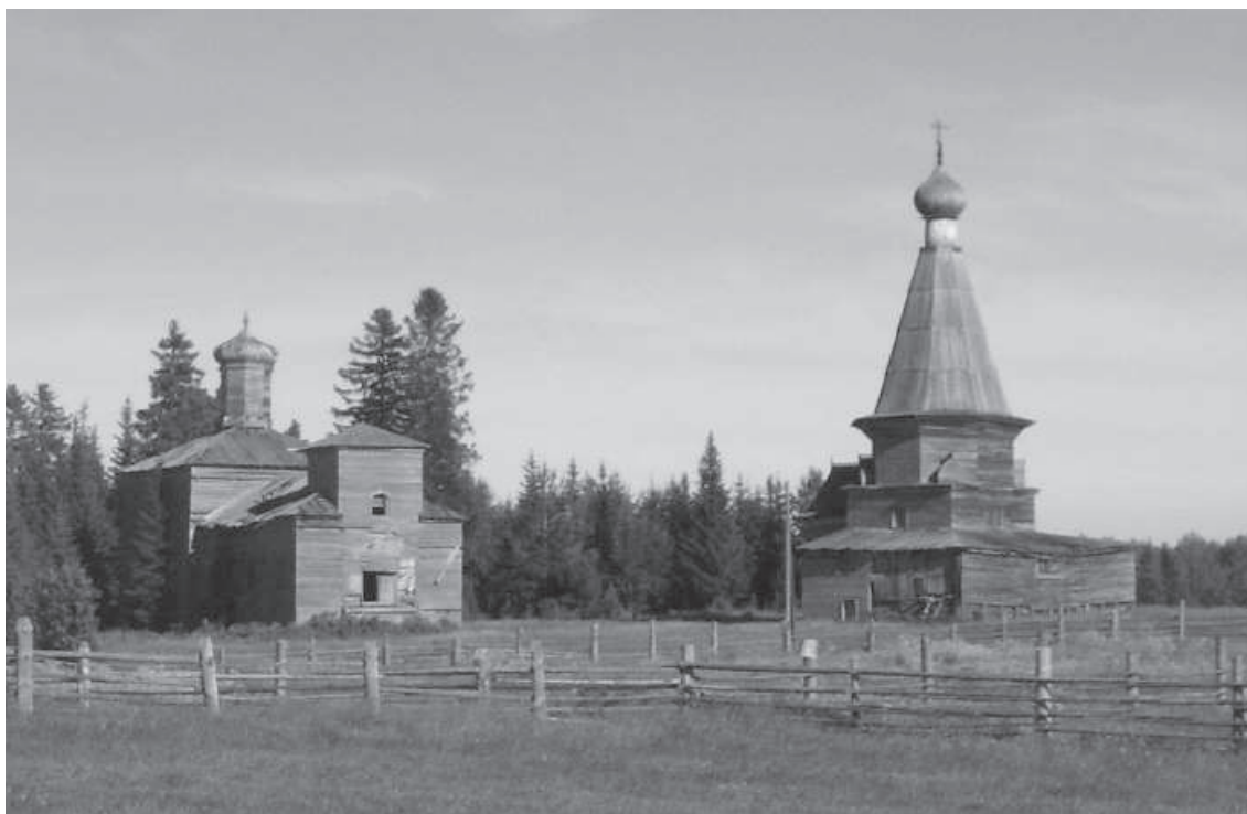
Рисунок 2. Храмовый комплекс в Пурнеме. Фото автора, 2005 г.

века церковь в Пурнеме уже была. В книгах письма Якова Сабурова и Ивана Кутузова 1556 г. сказано: «В той же волостке в Пурнеме погост, а в нем церков Никола Чудотворец. На погосте ж двор непашенный, во дворе поп Иван, во дворе пономарь Иванко без пашни» 15 .