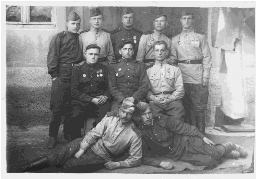
Воздушные стрелки 187-го Гвардейского штурмового авиационного полка.

Снимок сделан в период с 31.01.1945 по 07.04.1945 (скорее всего, ближе к последней дате).