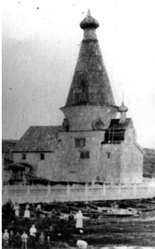
Церковь Богоявления Господня (XVII в.), с. Кянда. Фото конца XIX в.