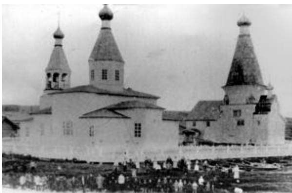
Шатровая церковь Богоявления Господня (XVII в.), и церковь Св. апостолов Петра и Павла (XIX в.), с. Кянда. Фото конца XIX в.