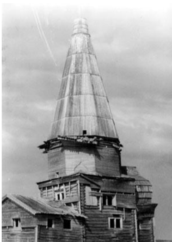
Церковь Николая Чудотворца, 1661 год в д. Нижнезеро. (1985 г.).