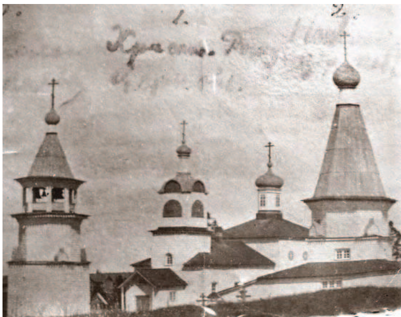
Рисунок 1. Храмовый комплекс в селе Пурнема. Фото начала XX века. Справа – шатровая Никольская церковь (1618?), в центре – Рождественская церковь с приделом св. Власия (1857–1861) и слева – колокольня (1772) – из: Бокарев и др. 2014 14 .